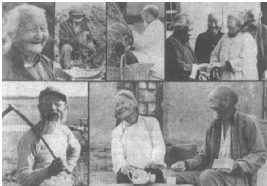
本版责任编辑 刘宪义

同志们，回顾过去，我们充满胜利的喜悦；展望未来，我们更是信心满怀。刚刚开过的党的十三届七中全会，为我国今后十年实现现代化建设的第二步战略目标，描绘了宏伟蓝图，指明了前进的方向，给全国人民以极大鼓舞。我们相信，(下转第三版)